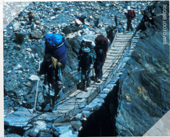
BIAFO FOOT BRIDGE

Μια φιλική χειρονομία από το www.mypassport.gr - The first Greek travel-builder website